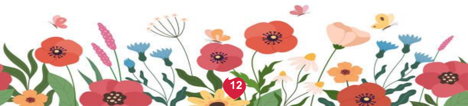
Solution du mois de mars